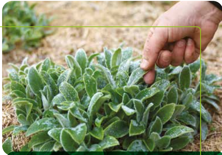
Stauden geht es besser, wenn der Standort ihren Bedürfnissen entspricht.