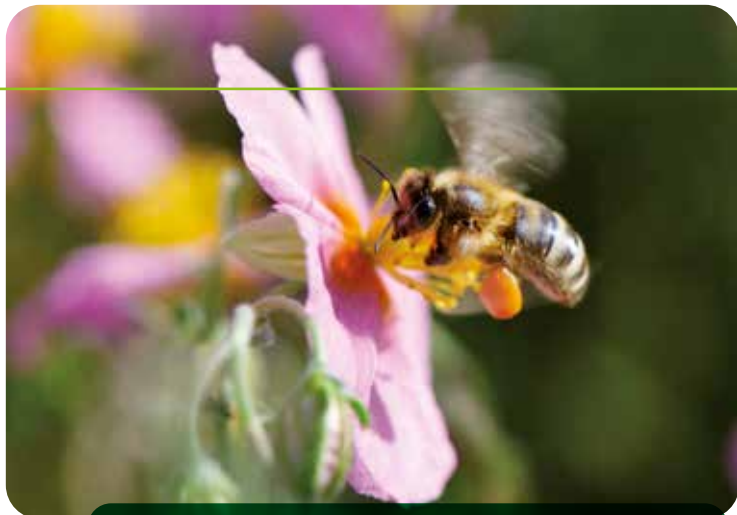
Offene, ungefüllte Blüten sind Futterquellen für Nützlinge.