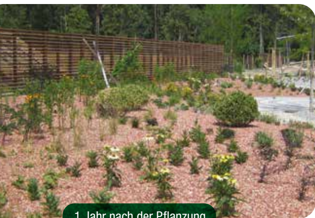
1 Jahr nach der Pflanzung

Qualitätsware ist optimal durchwurzelt, frei von Krankheiten, Schädlingen und Beikräutern. Dennoch stark verwurzelte Wurzelballen reißen Sie auf und wässern diese vor dem Auspflanzen gründlich. Ausgepflanzt wird bodeneben in frostfreie Böden. Andrücken, Gießen und Mulchen nicht vergessen.