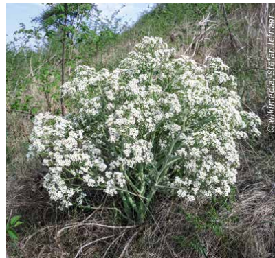
Angepasst an trocken-heiße Standorte: der Tartarische Meerkehl ( Crambe tataria )

Zu den Hauptursachen des Biodiversitätsverlustes werden nicht nachhaltige Praktiken in der Land- und Forstwirtschaft, Zersiedelung sowie Umweltverschmutzung gezählt 4 .