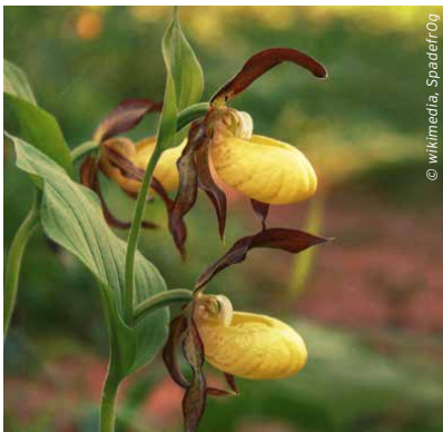
Der seltene Gelbe Frauenschuh ( Cypripedium calceolus ) braucht luftfeuchte, naturnahe Wälder als Lebensraum.