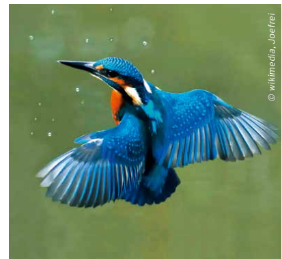
Naturnahe Steilufer sind der Lebensraum des Eisvogels ( Alcedo atthis ).

Natürlich beeinflusst auch der Klimawandel selbst sukzessive die Biodiversität, etwa durch die Verschiebung von Temperatur- und Niederschlagskurve, welche wesentlich das Vorkommen von Lebensräumen und Arten prägen.